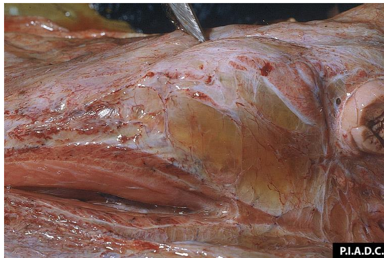
รูป 2 พบจุดเลือดออก และการบวมน้ำที่ชั้นใต้ผิวหนังบริเวณขากรรไกรอย่างรุนแรง