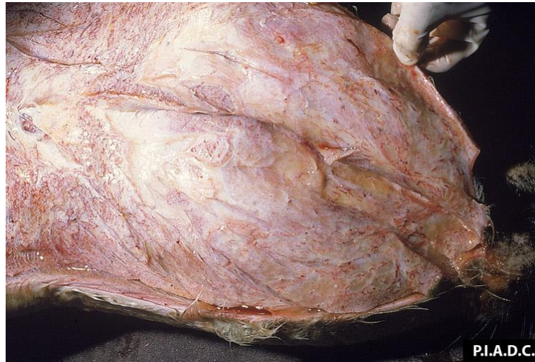
รูป 1 พบการบวมน้ำของเนื้อเยื่อชั้นใต้ผิวหนังบริเวณหัวและคอ

เมื่อเปิดผ่าซากสัตว์จะพบสารลักษณะคล้ายวุ้นแทรกอยู่ระหว่างผิวหนังและกล้ามเนื้อบริเวณที่บวม มีจุดเลือดออกที่ต่อมน้ำเหลืองและหัวใจ ปอดจะมีเลือดคั่ง หรือถ้าเป็นเรื้อรังจะพบเยื่อหุ้มปอดหนาตัวขึ้น เนื้อปอดแข็ง ภายในหลอดลมมีของเหลวปนฟองอากาศ ตับคั่งเลือดบวมขยายใหญ่ ถ้าใส่อีกเสบ ต่อมน้ำเหลืองบวมขยายใหญ่